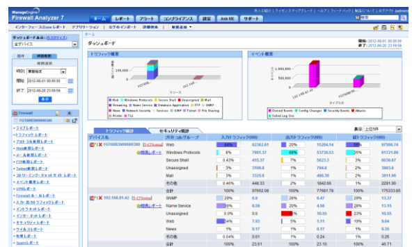
[ Firewall Analyzer ダッシュボード画面 ]

ネットワークごとの現在の状況把握に便利なライブレポートや、ホストごと/プロトコルごとのトラフィック使用量を表示するトラフィックレポートや Web 使用レポートなど、帯域分析に有効な情報を一覧やグラフでわかりやすく提供します。セキュリティ分析に有効なウイルスレポートや SSL-VPN など、各種 VPN 関連のレポート等も生成可能です。